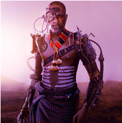
Ilustración: "Serengeti Cyborg", una representación artística del afrofuturismo por Fanuel Leul

Observa las imágenes y lee las preguntas y reflexiona sobre cómo sería, sonaría y se sentiría tu propio "afrofuturo".