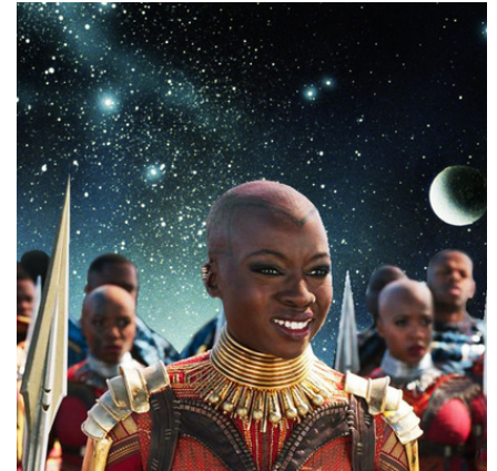
Ilustración: "La pantera negra" por Gabriela Landazuri/ HuffPost Images: Getty Images Walt Disney Pictures